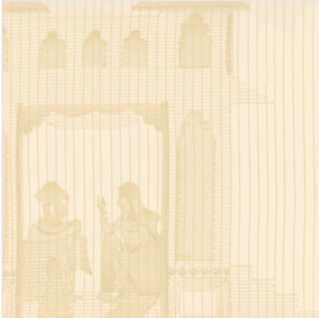
Product scan (≈25x25 cm) or picture