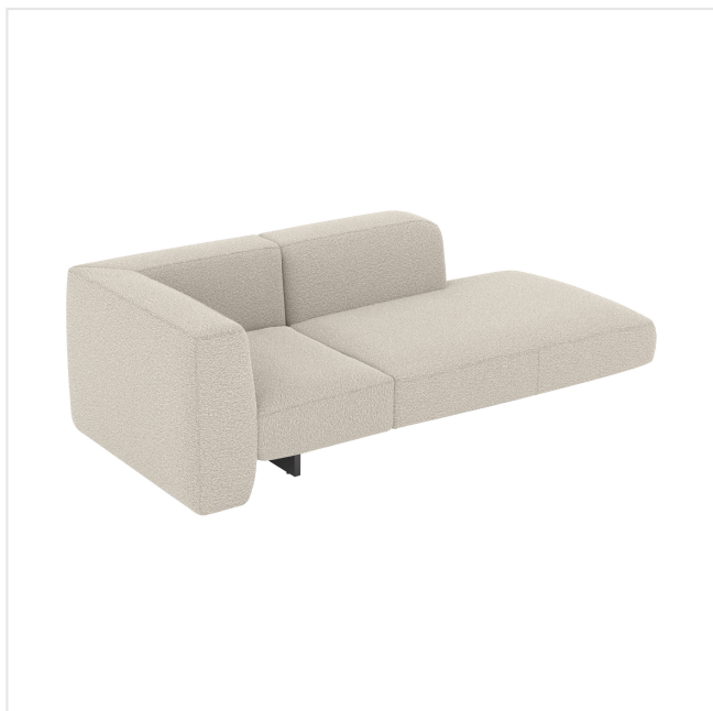
Product scan (=~25x25 cm) or picture