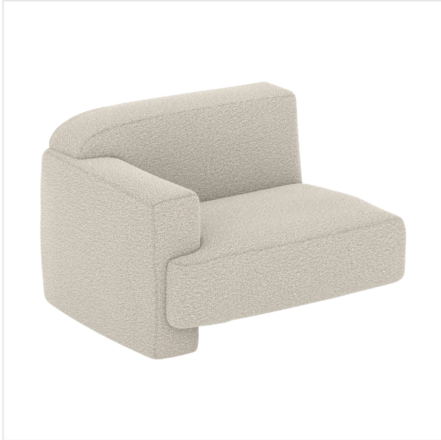
Product scan (=~25x25 cm) or picture