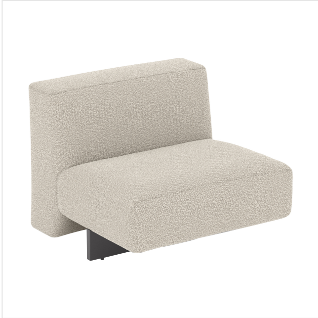
Product scan (=~25x25 cm) or picture