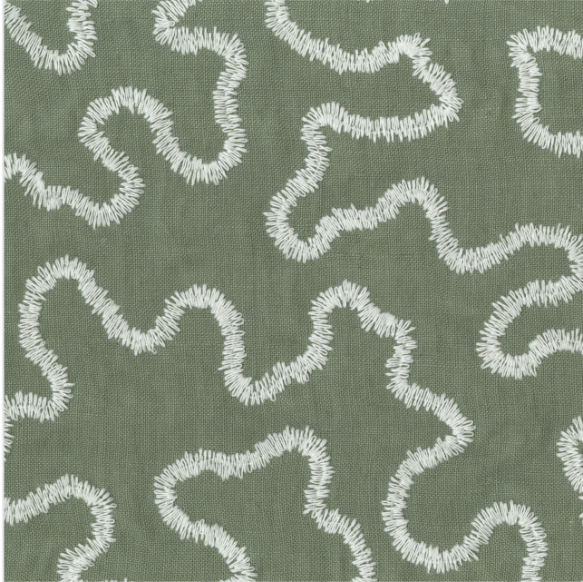
Product scan (≈25x25 cm) or picture