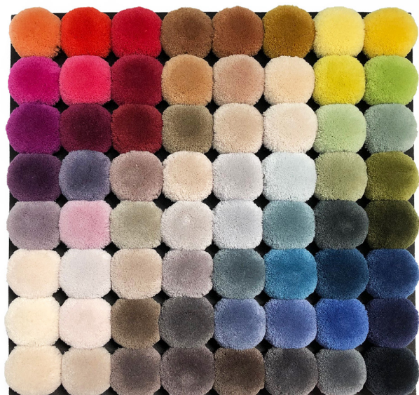
BASIC COLOURS WOOL