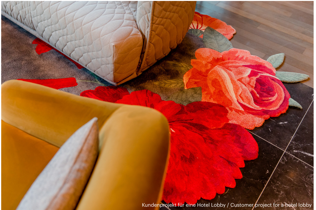
Kundenprojekt für eine Hotel Lobby / Customer project for a hotel lobby