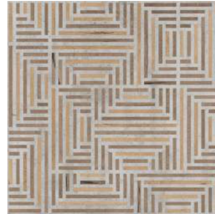
90x90 36"x36" Maze 9090* CSAMAZE190