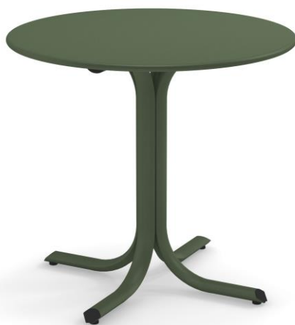
Table System è l'innovativa collezione di tavoli progettata dal Centro Ricerche EMU per rispondere alle molteplici esigenze del settore Contract. Un'ampia gamma di tavoli tondi, quadrati e rettangolari, con piani abbattibili e non; un progetto all'insegna della massima versatilità, per integrarsi naturalmente in qualsiasi contesto e abbinarsi ad ogni modello di seduta EMU.