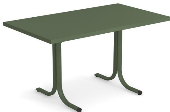
Table System è l'innovativa collezione di tavoli progettata dal Centro Ricerche EMU per rispondere alle molteplici esigenze del settore Contract. Un'ampia gamma di tavoli tondi, quadrati e rettangolari, con piani abbattibili e non; un progetto all'insegna della massima versatilità, per integrarsi naturalmente in qualsiasi contesto e abbinarsi ad ogni modello di seduta EMU.